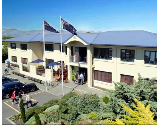
CITY, MOUNTAINS, SNOW & SEA CHRISTCHURCH

学校名: Seafield School of English 所在地: 71 Beresford Street, Christchurch – P.O. Box 18516, Christchurch, New Zealand 所在地: 開講日: 毎週月曜 レベル数: 6 最低受講期間: 1週間～ 滞在方法: ホームステイ おすすめコース: ● 一般英語 ● アカデミック英語 ● 試験対策コース