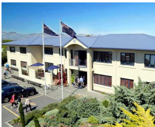
CITY, MOUNTAINS, SNOW & SEA CHRISTCHURCH

学校名: Seafield School of English 所在地: 71 Beresford Street, Christchurch – P.O. Box 18516, Christchurch, New Zealand 所在地: 開講日: 毎週月曜 レベル数: 6 最低受講期間: 1週間～ 滞在方法: ホームステイ おすすめコース: ● 一般英語 ● アカデミック英語 ● 試験対策コース